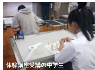
体験講座受講の中学生

10月26日(土)に予定している本校の中学3年生対象オープンスクール体験講座では、<模型体験>を2講座開講します。