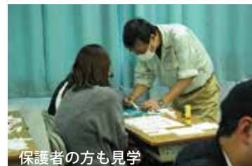
保護者の方も見学