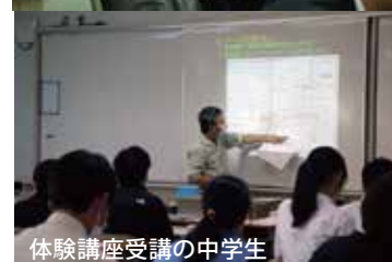
体験講座受講の中学生