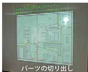
パーツの切り出し