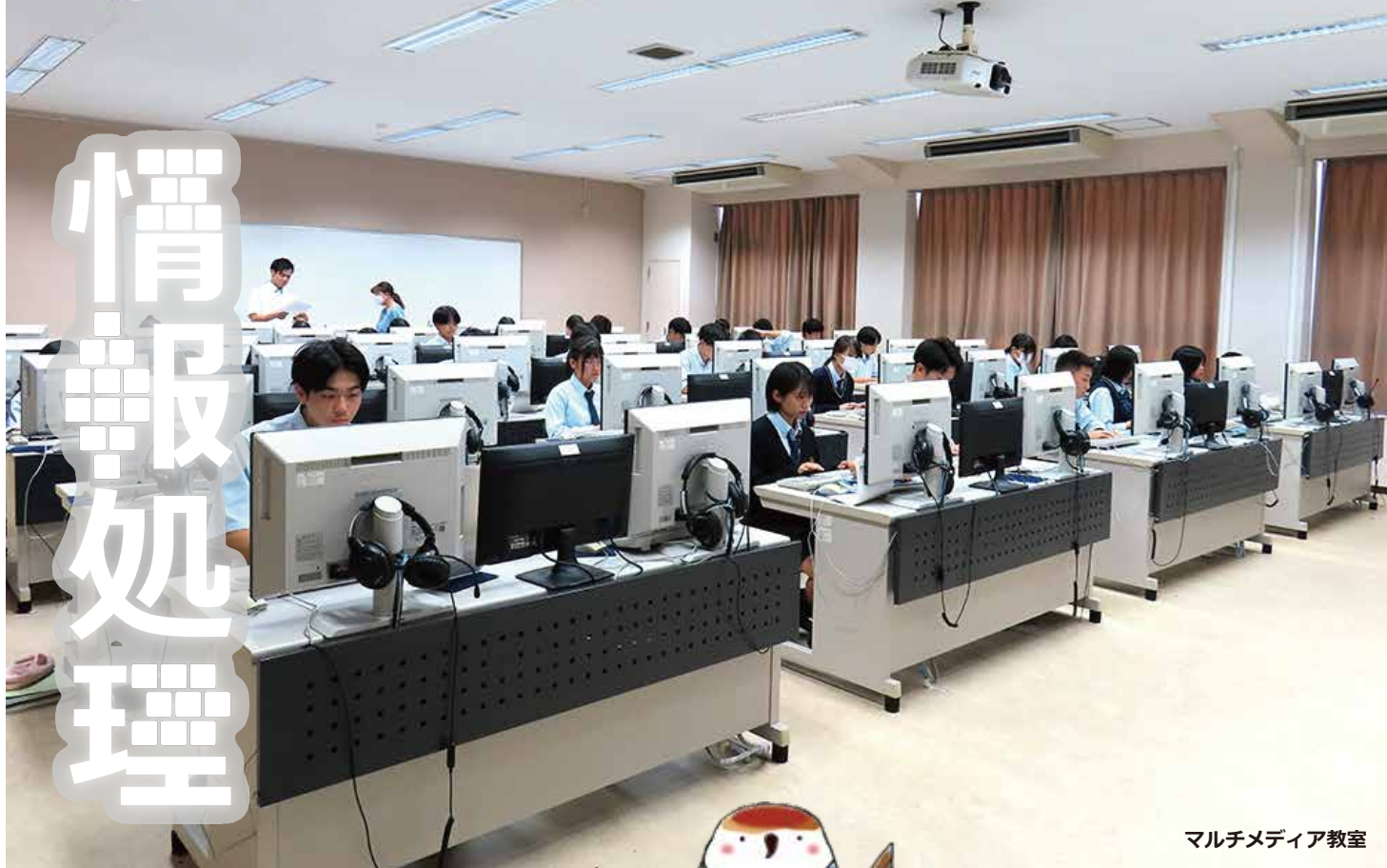
マルチメディア教室